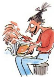
2. Le droit de sauter des pages