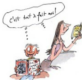
6. Le droit au bovarysme