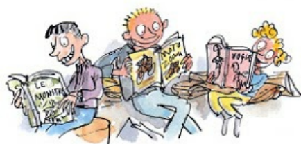
5. Le droit de lire n'importe quoi