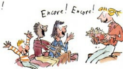
4. Le droit de relire