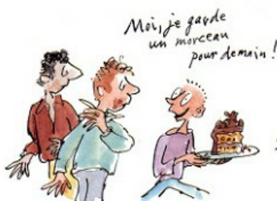
3. Le droit de ne pas finir un livre