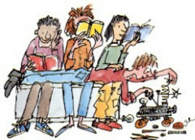
1. Le droit de ne pas lire